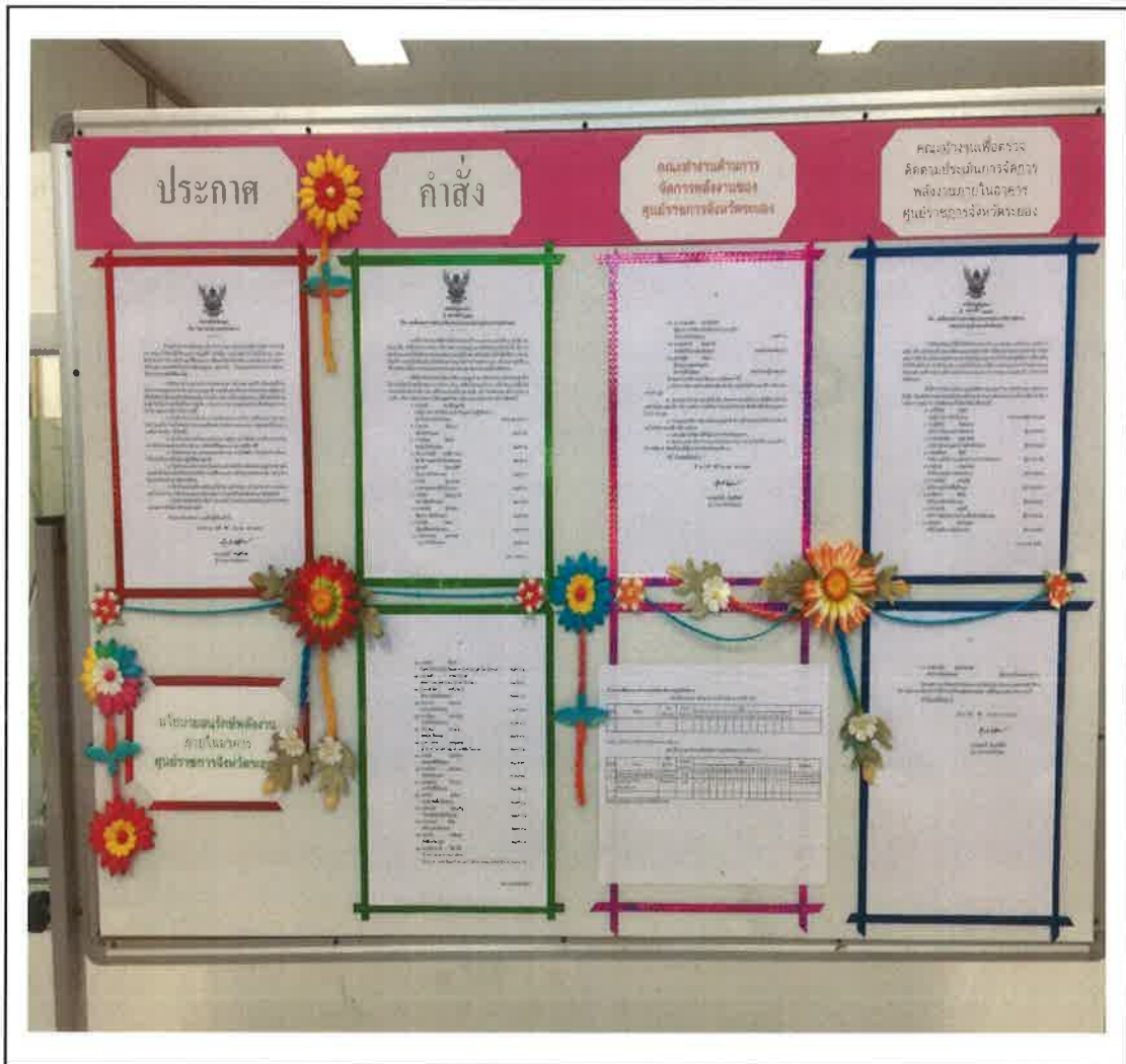
(ก) ประกาศคณะทำงานให้กับทุกสำนักงานในศูนย์ราชการจังหวัดระยอง