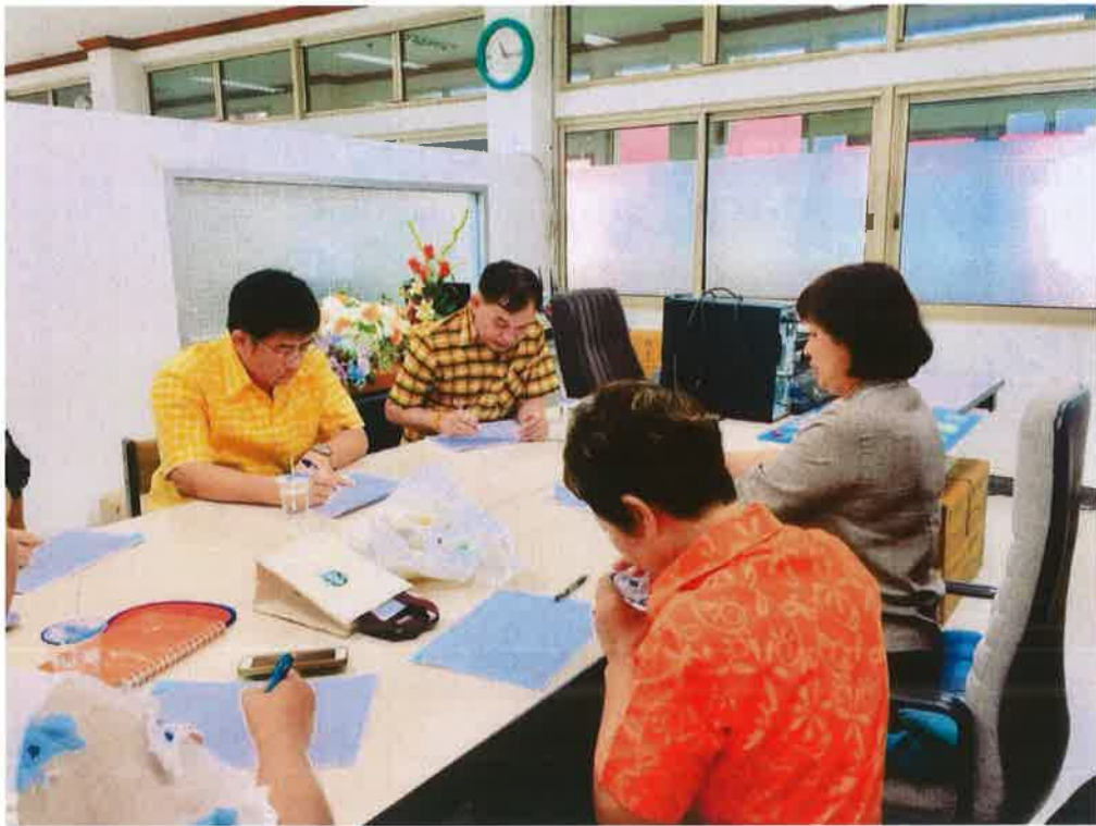
(ก) ประชุมแจ้งนโยบายให้กับทุกสำนักในศูนย์ราชการจังหวัดระยอง